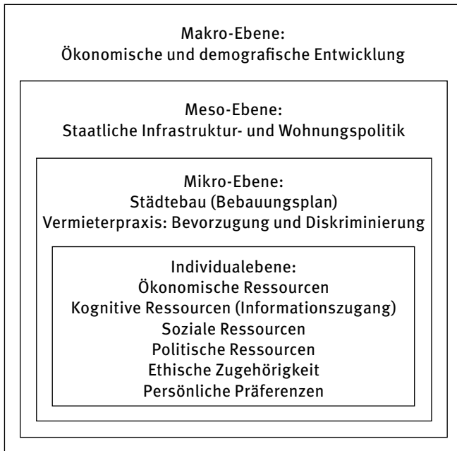
Abb. 1: Determinanten der Wohnstandortentscheidung 21

Segregierend wirken einerseits die Angebote des Wohnungsmarktes einer Stadt, weil qualitative Wohnungen ungleichmäßig im Stadtgebiet verteilt sind, und andererseits die Nachfrage, weil sich die Menschen ungleichmäßig auf die unterschiedlichen Segmente des Angebots verteilen. 20